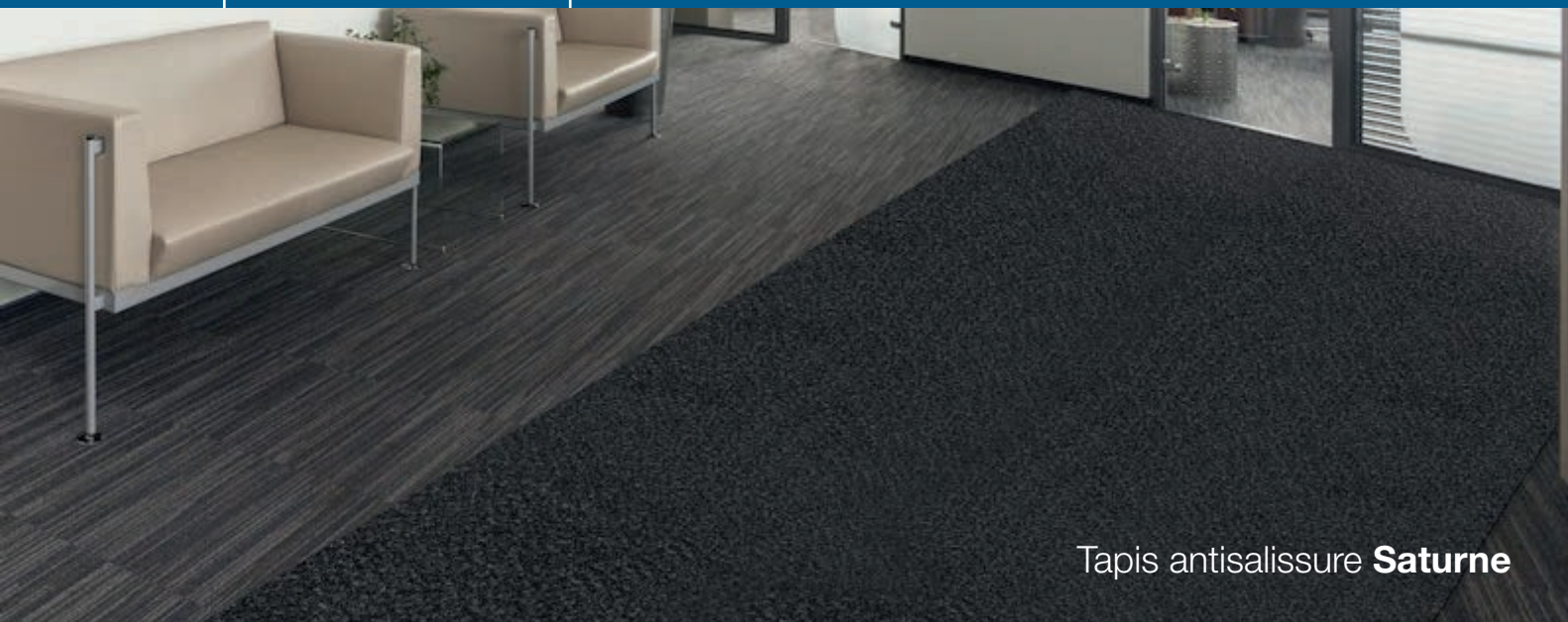
Tapis antisalissure Saturne