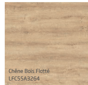
Chêne Bois Flotté LFC55A3264