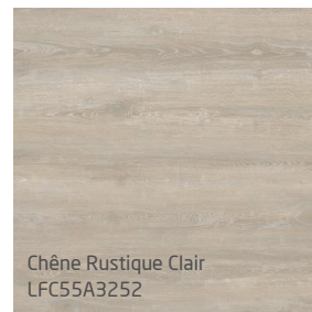
Chêne Rustique Clair LFC55A3252