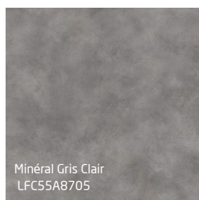
Minéral Gris Clair LFC55A8705