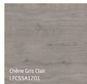
Chêne Gris Clair LFC55A1201